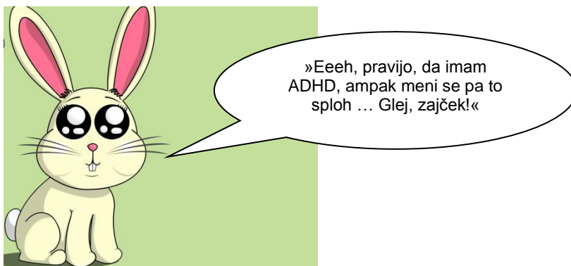
Slika 4: Motnje koncentracije in pozornosti še vedno ne prepoznavamo z lahkoto

B. Na podlagi zbranih podatkov in spoznanj presodi, kako bi lahko dobro ločevali med učencem, ki se mu ne da učiti, in učencem, ki ima motnjo koncentracije?