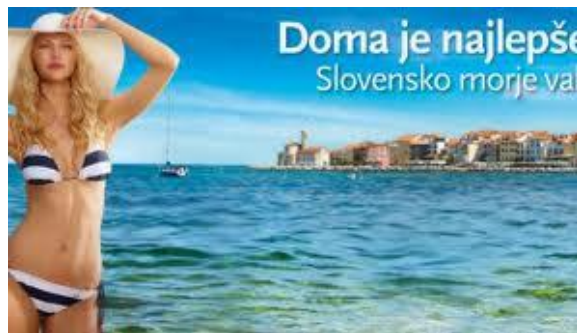
Slika 5: Oglasa