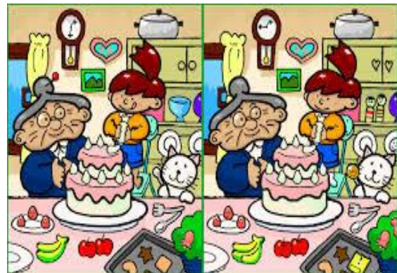
Slika 2: Pri babici. V čem se obe sliki razlikujeta?

2. Če si našel na obeh slikah podrobnosti, po katerih se razlikujeta, potem si moral biti POZOREN . Preberi tekst z naslovom Pozornost v učbeniku Uvod v psihologijo in tekst z naslovom Pozornost, v učbeniku Psihologija. Spoznanja in dileme, nato odgovori na spodnja vprašanja.