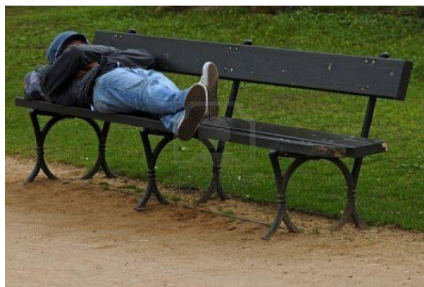
Slika 1: Spanje kot temeljna telesna/fiziološka potreba