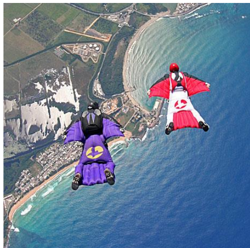
Slika 2: Letenje s posebno obleko s krilci (angl. wingsuit)