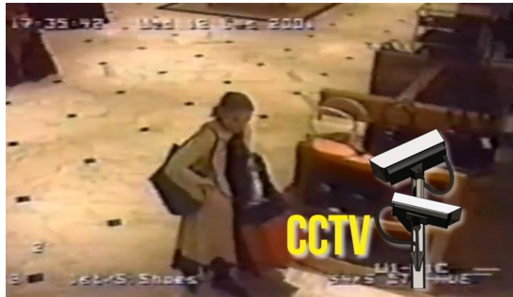
Slika 5 : Kakšen psihološki pojav prepoznaš v posnetku slavne igralko Winone Rider?

c) Presodi, kaj bi bili možni vzroki za tako vedenje?