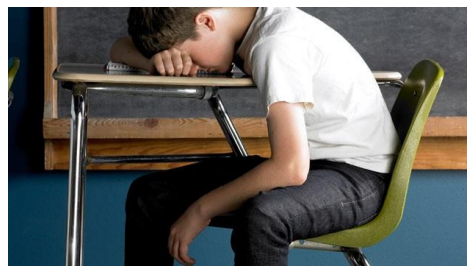
Slika 4: Ali je bila ta potreba ozaveščena?

a) Kaj nam omogoča, da ozavestimo svoje fiziološke potrebe?