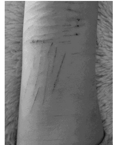
Slika 6: Samopoškodovanje kot pojav, katerega motive težko razumemo