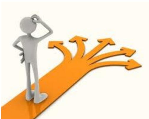
Slika 3: Ljudje se neprestano odločamo o svojih ciljih in načinih, kako priti do njih