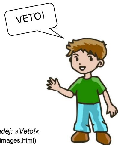
Slika 2: Tadej: »Veto!«