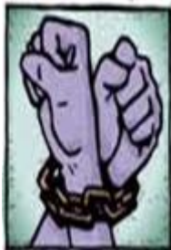
Slika 1: Svoboda ali spona

B. Napiši, katero vrednoto bi želel poudariti avtor spodnjih slik.