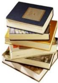
Slika 3: Knjige – vir znanja