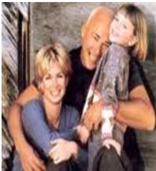
Slika 2: Kaj nas osrečuje