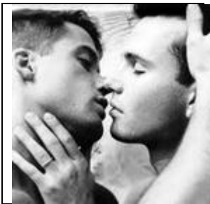
Slika 1: Predsodki do homoseksualcev

C. Presodi, kaj bi lahko storili, da bi zmanjšali škodljive posledic, ki nastanejo zaradi sledečih predsodkov.