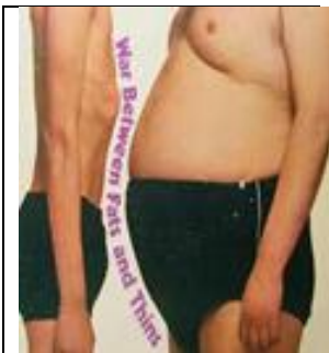
Slika 4: Presuhi in predebeli