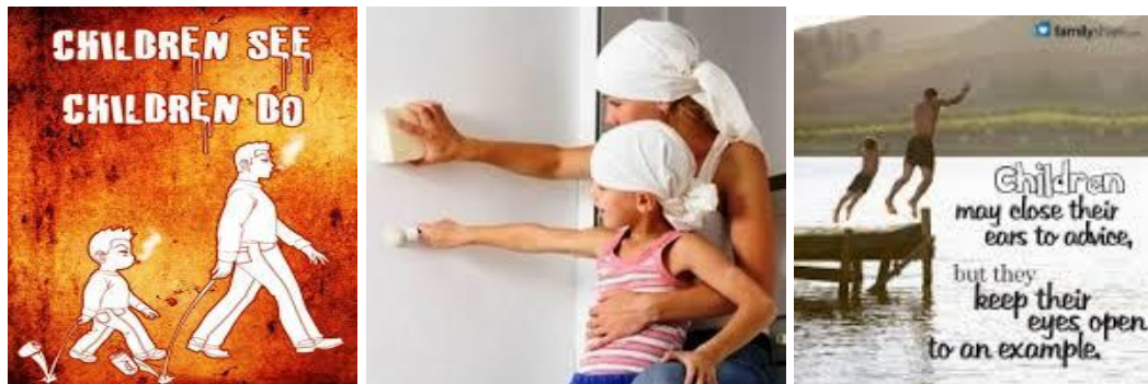
Slike 3: dostopne na google, children see, children do.

biti podobni. Imitacija včasih poteka zavestno (hočem biti tako priljubljen kot on, zato ga začnem posnemati), pogosteje pa temelji na nezavednem obrambnem mehanizmu identifikacije. Več o tem zanimivem pojavu izveste, če si ogledate vajo »Modelno učenje« in če se spomnite znanih eksperimentov o posnemanju Bandrure (kratek posnetek je dostopen na povezavi Bandura doll youtube ). Pojasnite značilnosti modelnega učenja, naštejte faze modelnega učenja in pojasnite spoznanja Bandurovih eksperimentov.