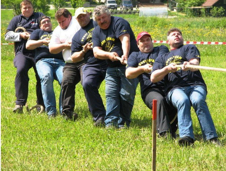
Slika 7: vir google, slike, vlečenje vrvi.