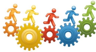
Slike 1: dostopne na google, slike, skupina in skupinski cilji.