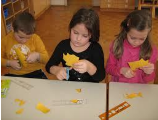
Slika 5: Sneto z google slike, vpliv drugih.