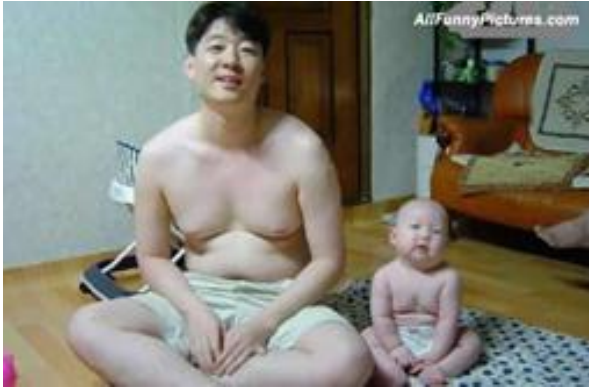
Slika 1: Oče in sin.