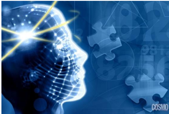
Slika 3: Inteligentnost

(Slika dostopna na naslovu: http://matura.cosmopolitan.si/novice/verbalna-matematicno-logicna-in-prostorska-inteligentnost/galerija/shutterstock_67496746jpg/ (datum vpogleda: 22. 2. 2012))