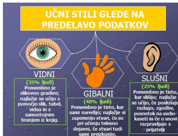
Slika 2: Učni stili

(ikone uporabljene na sliki dostopne na straneh: http://www.clker.com/ (datum vpogleda: 23. 2. 2012))