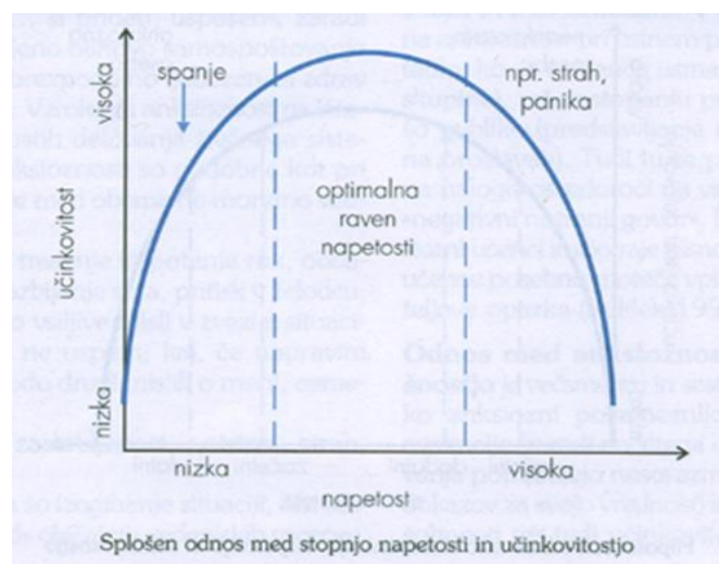
Slika 4 : Splošen odnos med stopnjo napetosti in učinkovitostjo