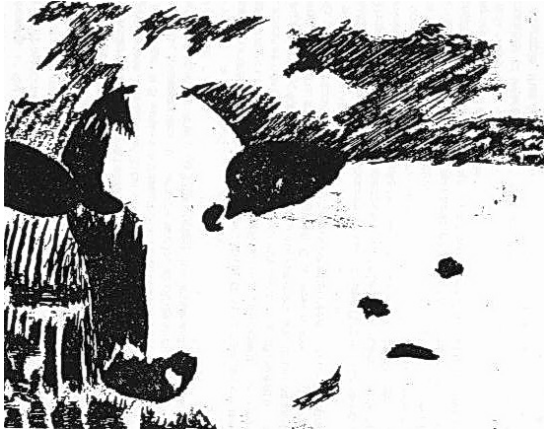
Slika 2: Zmešnjava ali ...