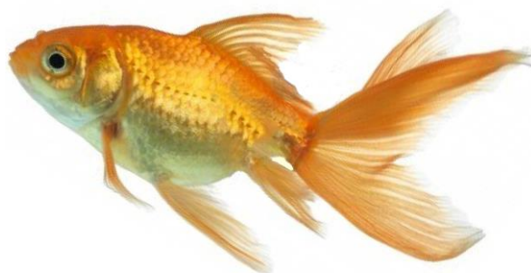
Slika 1: Zlata ribica