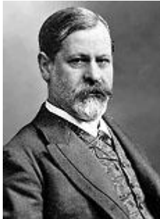
Sigmund Freud (1856 – 1939)